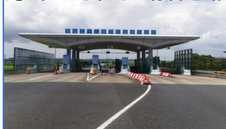
④ 東金九十九里有料道路