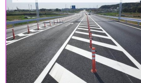
銚子連絡道路二期・三期