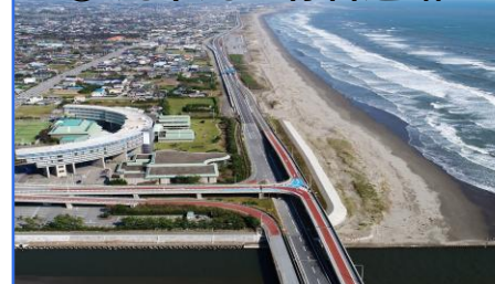
③ 九十九里有料道路