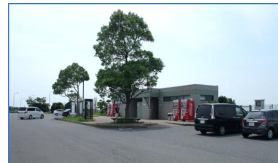
福俵駐車場 (東金九十九里有料道路)