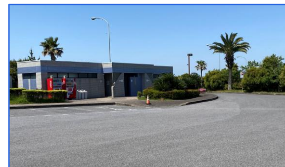
今泉駐車場 (東金九十九里有料道路)