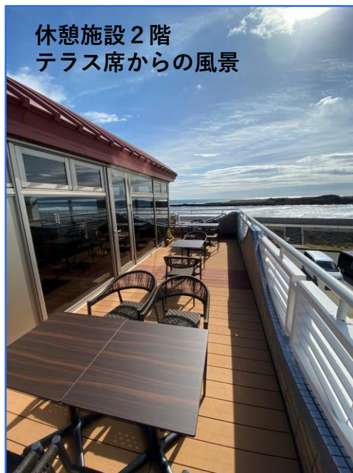
休憩施設 2 階 テラス席からの風景