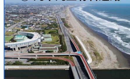
③ 九十九里有料道路